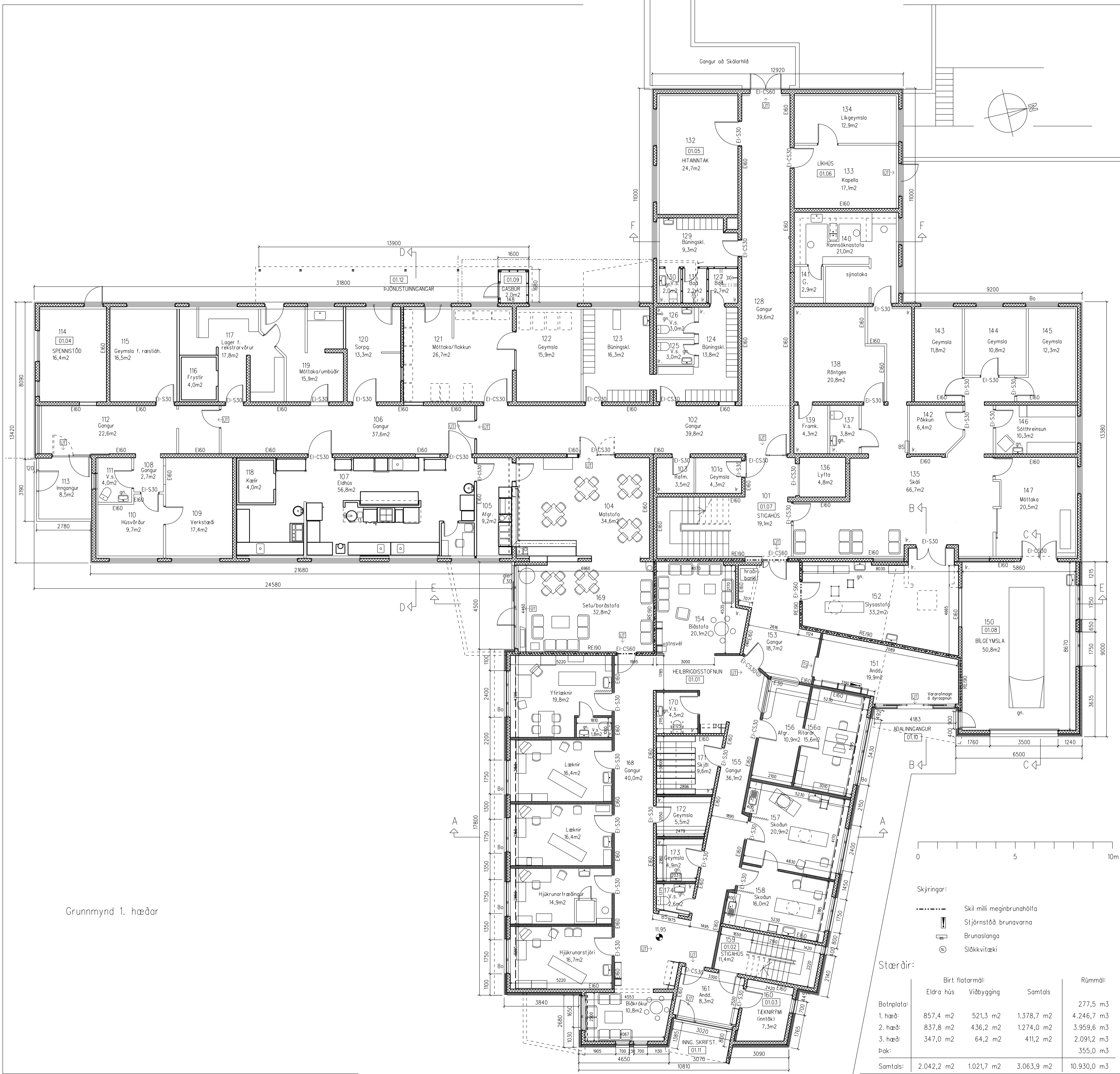
Grunnmynd 1. hæðar