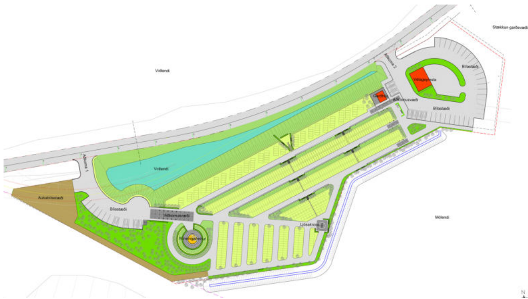
Mynd 4. Tillaga að innra skipulagi núverandi garðsvæðis ásamt aðkomusvæðum. Þessu plani hefur verið fylgt að hluta til síðustu ár.

Með aðkomusvæðum mælist núverandi garðsvæði um 1,3 ha. Grafartæk svæði eru ríflega 0,2 ha, stígar og bílastæði 0,5 ha og 0,6 ha fara undir grasfláa (landmótun), gróðursvæði, þjónustu og svæði fyrir afvötnun. Þessi hlutföll gefa vísbendingu um viðbótar landnýtingu og rýmisþörf. Eðli málsins samkvæmt fer töluvert landrými í brekkur / fláa þegar land er stallað fyrir grafreiti stóra og smáa ásamt stígum og tilheyrandi. Grafarsvæði þarf ekki endilega að vera flatt en tryggja þarf gott aðgengi fyrir alla gesti og þá sem sinna umhirðu svæðisins. Kistugrafir eru algengasta fyrirkomulag greftrunar í núverandi garði og samkvæmt skipulagi ætti að vera mögulegt að koma fyrir um 600 kistugröfum á þessu árabili. Þessu til viðbótar er svæði fyrir allt að 60 duftker í núverandi garði en mun minni nýting er á þeim reit enn sem komið er. Líkbrennsla sem einungis er til staðar í Fossvogi í Reykjavík skýrir þessa stöðu að mestu. Talið er að þessi hlutföll geti snúist á komandi árum þegar / ef líkbrennsla hefst utan höfuðborgarsvæðisins t.d. á Akureyri. Þá er að eiga sér stað ákveðin umræða / nýsköpun varðandi fyrirkomulag greftrunar sem leitt getur til fjölþættari umgjörðar fyrir þennan málaflokk.