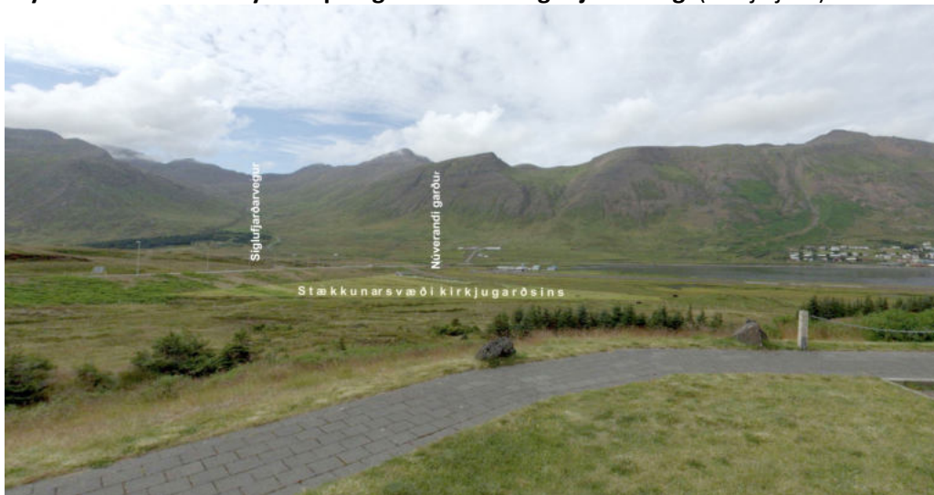
Mynd 7. Horft vestur yfir skipulagssvæðið frá áningarstað Vegagerðarinnar (vefsjá já.is).