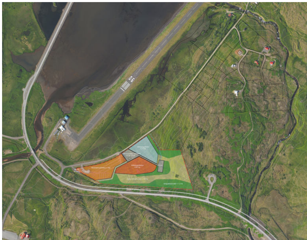
Mynd 5. Deiliskipulagssvæðið – samtals 6 ha. Myndin sýnir jafnframt legu fyrirhugaðs göngu- og hjólastígs meðfram Siglufjarðarvegi