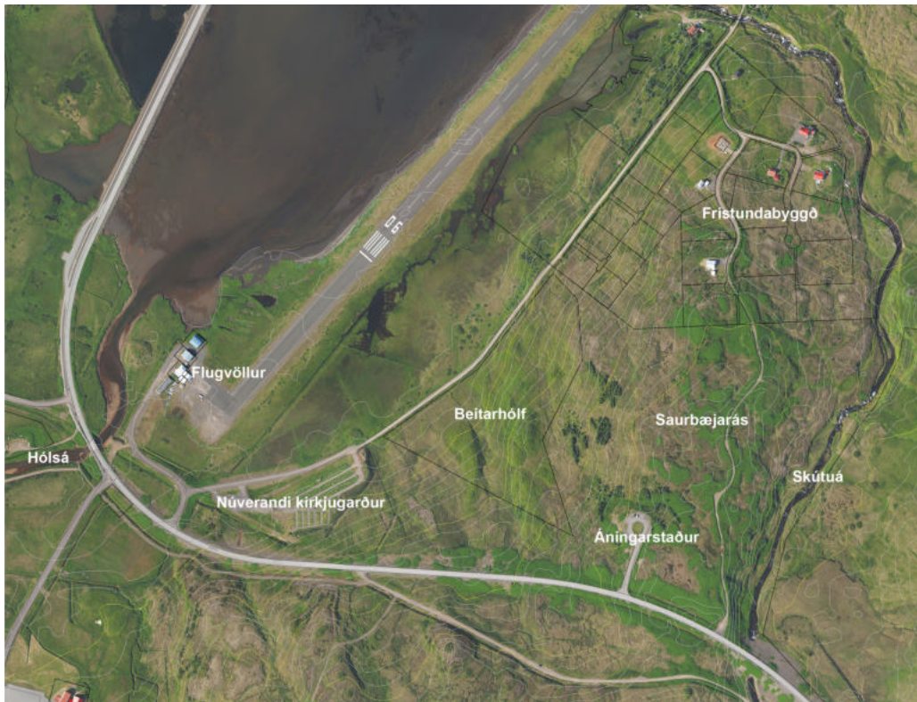
Mynd 3. Loftmynd af skipulagssvæði og nærliggjandi umhverfi.

Saurbæjarás fellur til norðurs undan Hólshyrnu sem liggur á milli Skútudals og Hólisdals. Deiliskipulagssvæðið situr vestan megin í ásnum og afmarkast af Siglufjarðarvegi (þjóðvegur nr.76), til suðurs og vesturs, Ráeyrarvegi til norðurs og Saurbæjarási til austurs. Núverandi grafreitir er fremur neðarlega í Saurbæjarásnum sem myndar fallegt bakland fyrir garðsvæðið (mynd 3). Þarna má m.a. finna litla skógræktarreiti og áningarstað Vegagerðarinnar. Svæðið hefur lengst af verið einskonar jaðarsvæði og hluti þess er nýtt sem beitarhólf fyrir hross. Siglufjarðarvegur var byggður upp samhliða jarðgangagerð og opnaður 2010. Hann liggur í sveig meðfram syðsta hluta garðsins eilítið hærra í landinu en núverandi grafarstæði. Ráeyrarvegur er eldri og var syðsta hluta hans breytt til að gera öruggari tengingu við hinn nýja þjóðveg. Garðssvæðið er nú í alfaraleið þar sem það situr í krikanum sem þessar vegtengingar afmarka. Aðkomur í garðinn verða áfram frá Ráeyrarvegi.