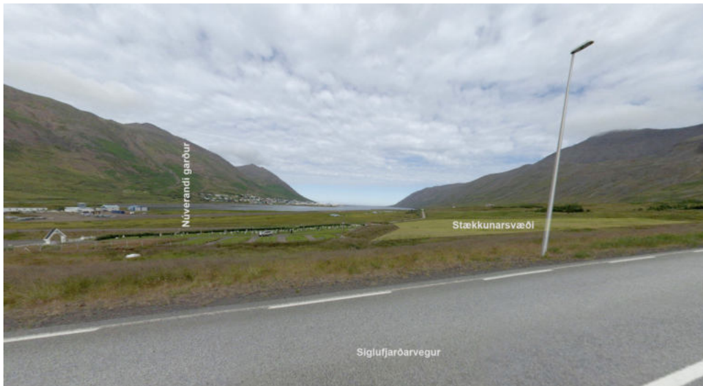
Mynd 6. Horft norður yfir skipulagssvæðið frá Siglufjarðarvegi.