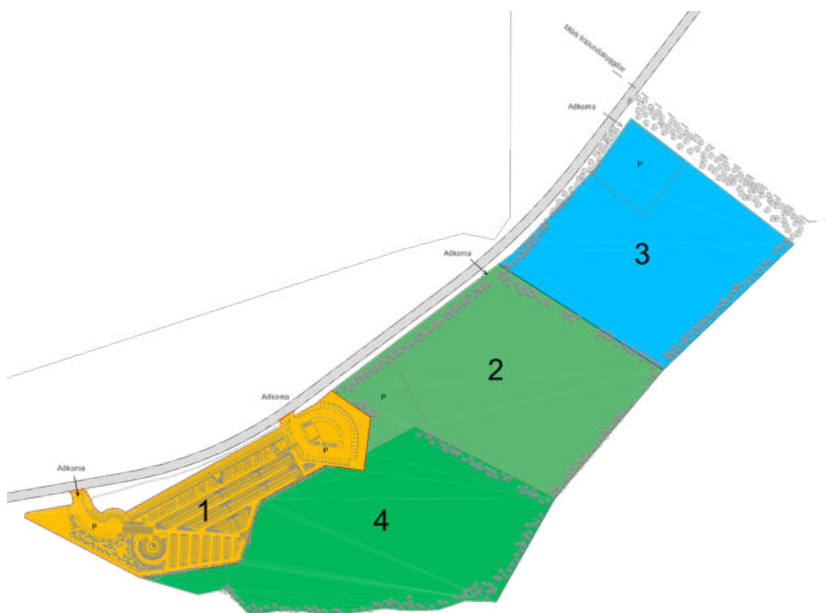
Mynd 2. Yfirlitsmynd af núverandi garðsvæði (1) ásamt áfangaskiptum stækkunarmöguleikum 2,3,4 við Saurbæjarás – tillaga frá 2009.