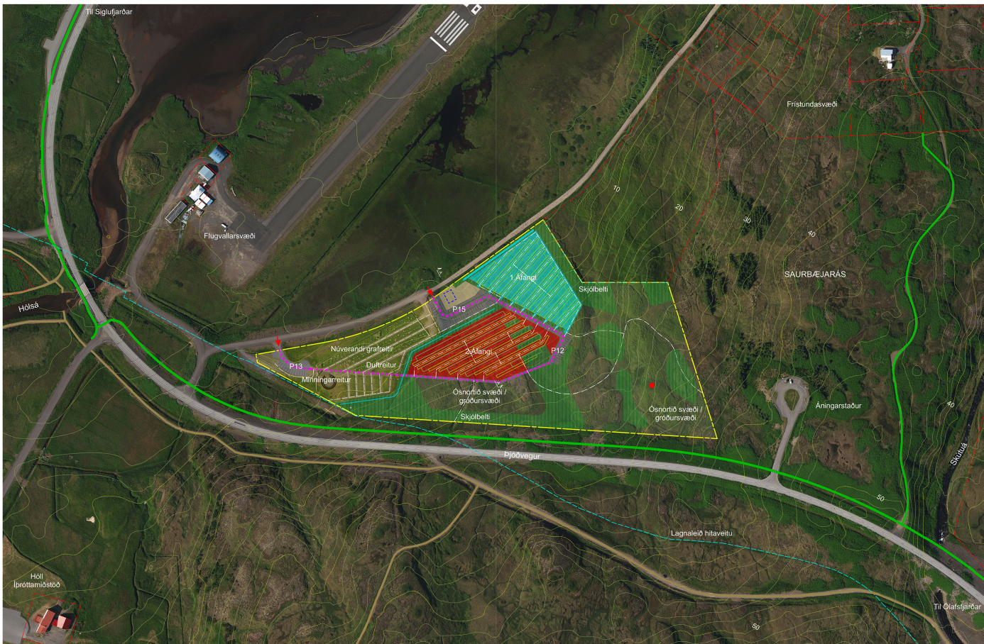
DEILISKIPULAG MKV. 1:2000