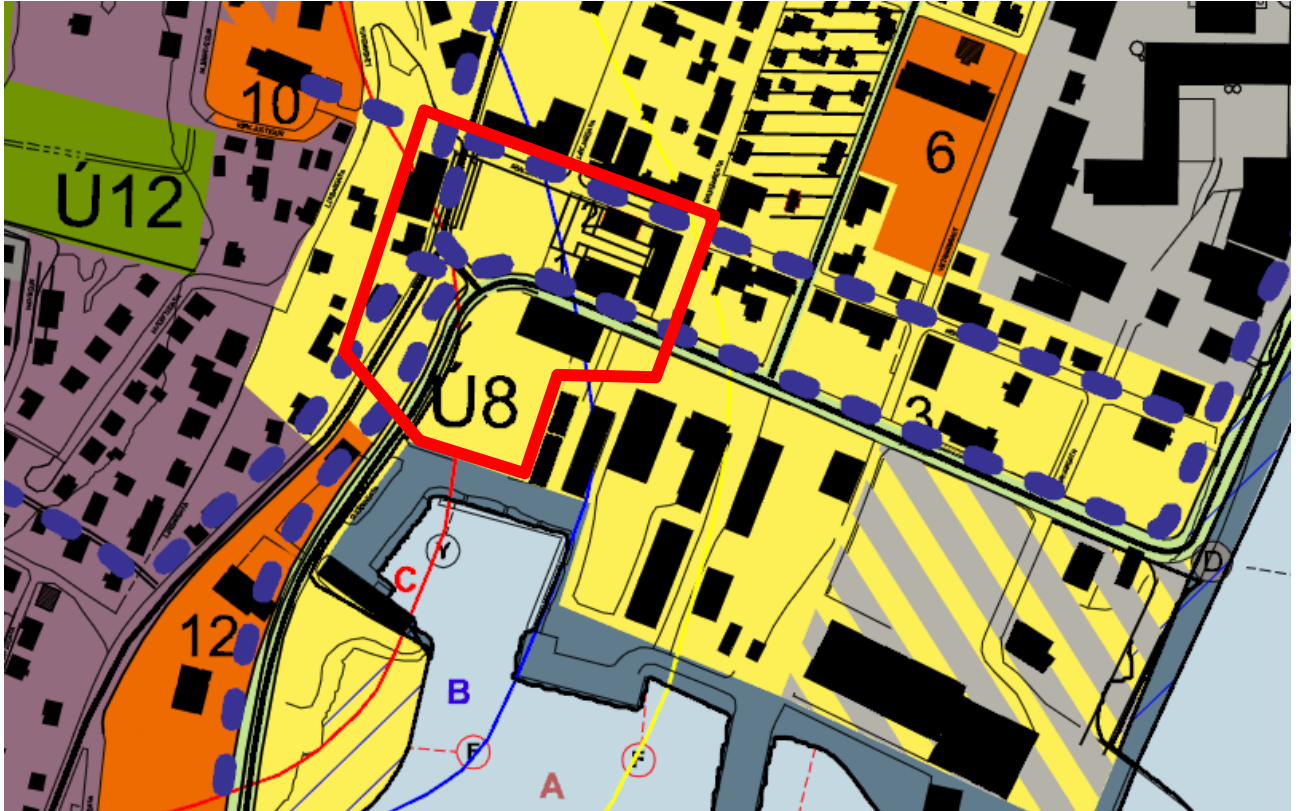
Mynd 2. Hluti aðalskipulags Fjallabyggðar, Siglufjörður, 2008-2028 (rauð útlína sýnir það svæði sem deiliskipulagið nær yfir).