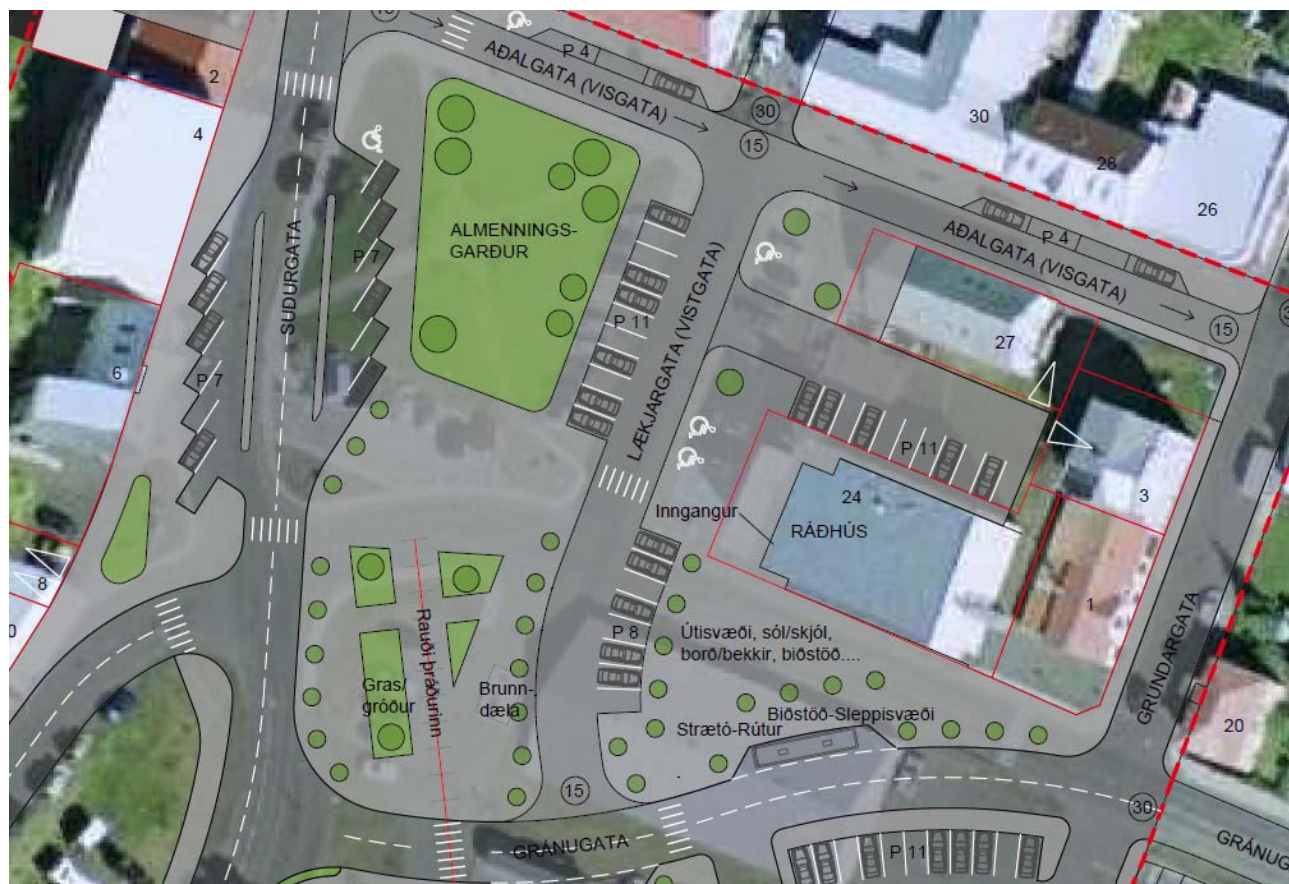
Mynd 5. Möguleg útfærsla á Ráðhúsreit.

Sunnan Ráðhússins skapast sólríkt og skjólsælt svæði með færslu Gránugötu til suðurs. Þar er gert ráð fyrir almenningsrými og útisvæði sem gæti nýst vegna þeirrar starfsemi sem er í Ráðhúsinu, s.s. upplýsingamiðstöð ferðamála og bókasafn. Þar sem Lækjargata er vistgata á þessum stað er þetta almenningsrými mjög tengt torgsvæðinu handan Lækjargötu og getur m.a. nýst þegar stærri viðburðir eru í miðbæ Siglufjarðar.