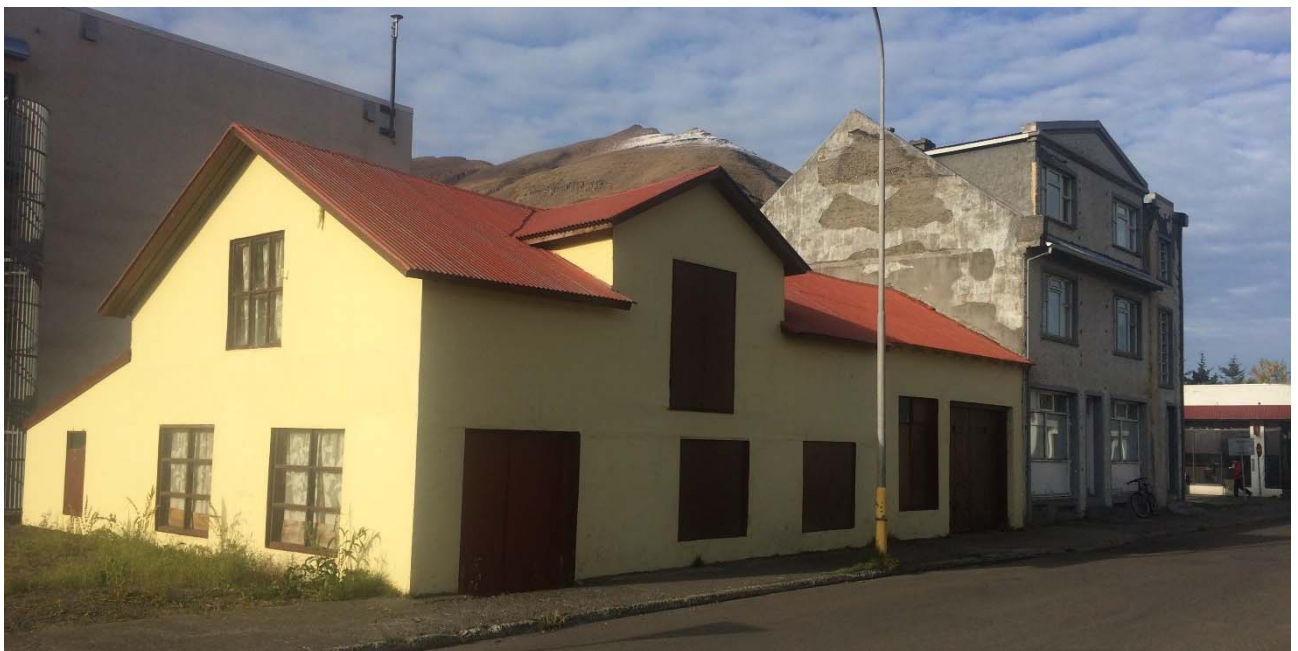
Mynd 3. Grundargata 1 (nær) og Grundargata 3 (fjær)

Tekið er undir þetta í deiliskipulagi og skal fengið álit Húsafriðunarnefndar við breytingar á húsunum.