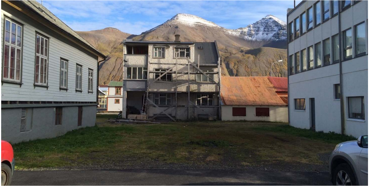
Mynd 9. Núverandi aðstæður, port á milli Ráðhússins og Aðalgötu 27 þar sem gert er ráð fyrir bílastæðum.

Suðurgata hliðrist til austurs á milli gatnamóta við Gránugötu og Aðalgötu. Þörf er á bílastæðum vegna verslunarstarfsemi í húsum við Suðurgötu en gert er ráð fyrir bílastæðum beggja megin götunnar á þessum stað, skástæðum (og akstursleið) sem eru aðskilin frá Suðurgötu með umferðareyjum. Gangstéttar verða við bílastæði og gangbrautir yfir Suðurgötu sunnan og norðan þeirra.