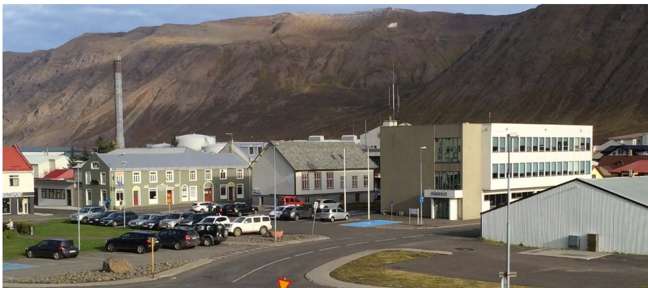
Mynd 4. Núverandi aðstæður, séð yfir Ráðhúsið, Aðalgötu 27 og nánasta umhverfi.

Við núverandi aðstæður eru bílastæði skilgreind fram við Ráðhúsið og Aðalgötu 27. Gert er ráð fyrir að bílastæði verði ekki framan við þessi hús fyrir utan stæði fyrir hreyfihamlaða, en þó er gert ráð fyrir nokkrum bílastæðum austan vistgötunnar Lækjargötu nær Gránugötu, sjá nánar í kafla 2.4.5.