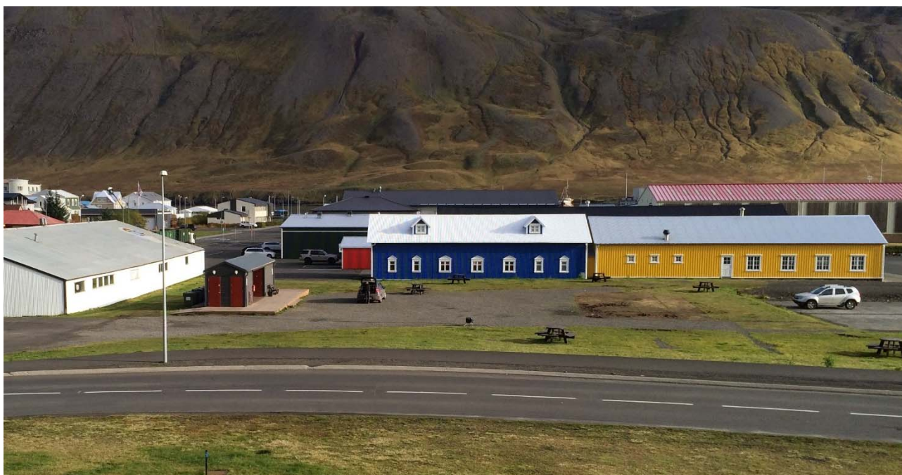
Mynd 6. Núverandi aðstaður, svæði norðan smábátahafnar.

Gert er ráð fyrir rými fyrir almenningssvæði og gönguleiðir norðan gönguássins sem liggur á milli bygginganna Hannes Boy Café og Kaffi Rauðku, auk aðkomusvæðis fyrir vörulosun veitingahúsanna.