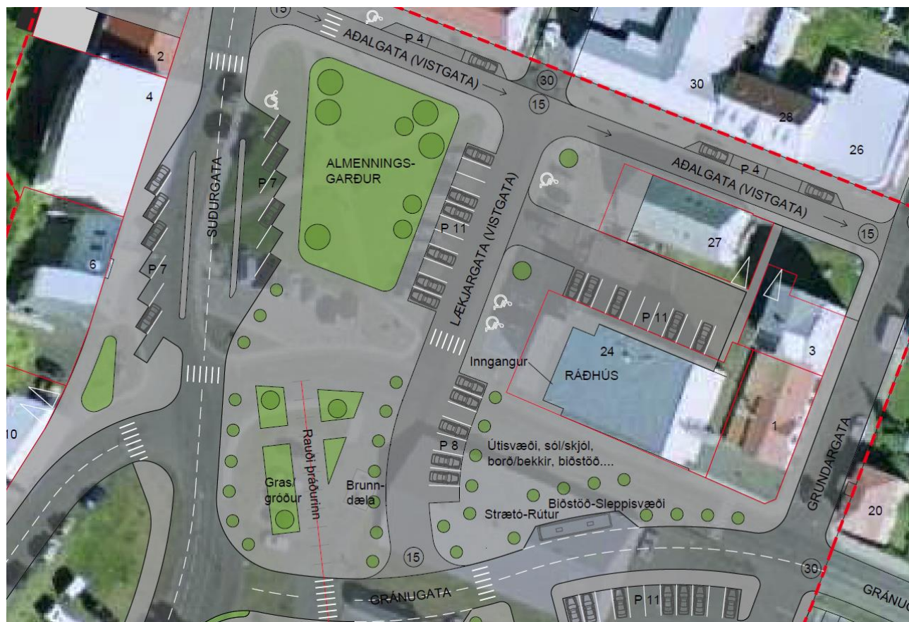
Mynd 5. Möguleg útfærsla á Ráðhúsreit.

Sunnan Ráðhússins skapast sólríkt og skjólsælt svæði með færslu Gránugötu til suðurs. Þar er gert ráð fyrir almenningsrými og útisvæði sem gæti nýst vegna þeirrar starfsemi sem er í Ráðhúsinu, s.s. upplýsingamiðstöð ferðamála og bókasafn. Þar sem Lækjargata er vistgata á þessum stað er þetta almenningsrými mjög tengt torgsvæðinu handan Lækjargötu og getur m.a. nýst þegar stærri viðburðir eru í miðbæ Siglufjarðar.