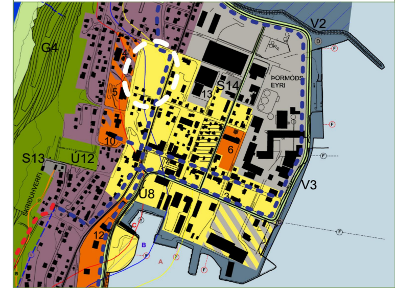
Aðalskipulag Fjallabyggðar 2008 - 2028 (ekki í kvarða)

Deiliskipulag þetta sem auglýst var skv. 41.gr. skipulagslaga nr.123/2010 frá _____ til _____ var samþykkt í bæjarstjórn Fjallabyggðar _____