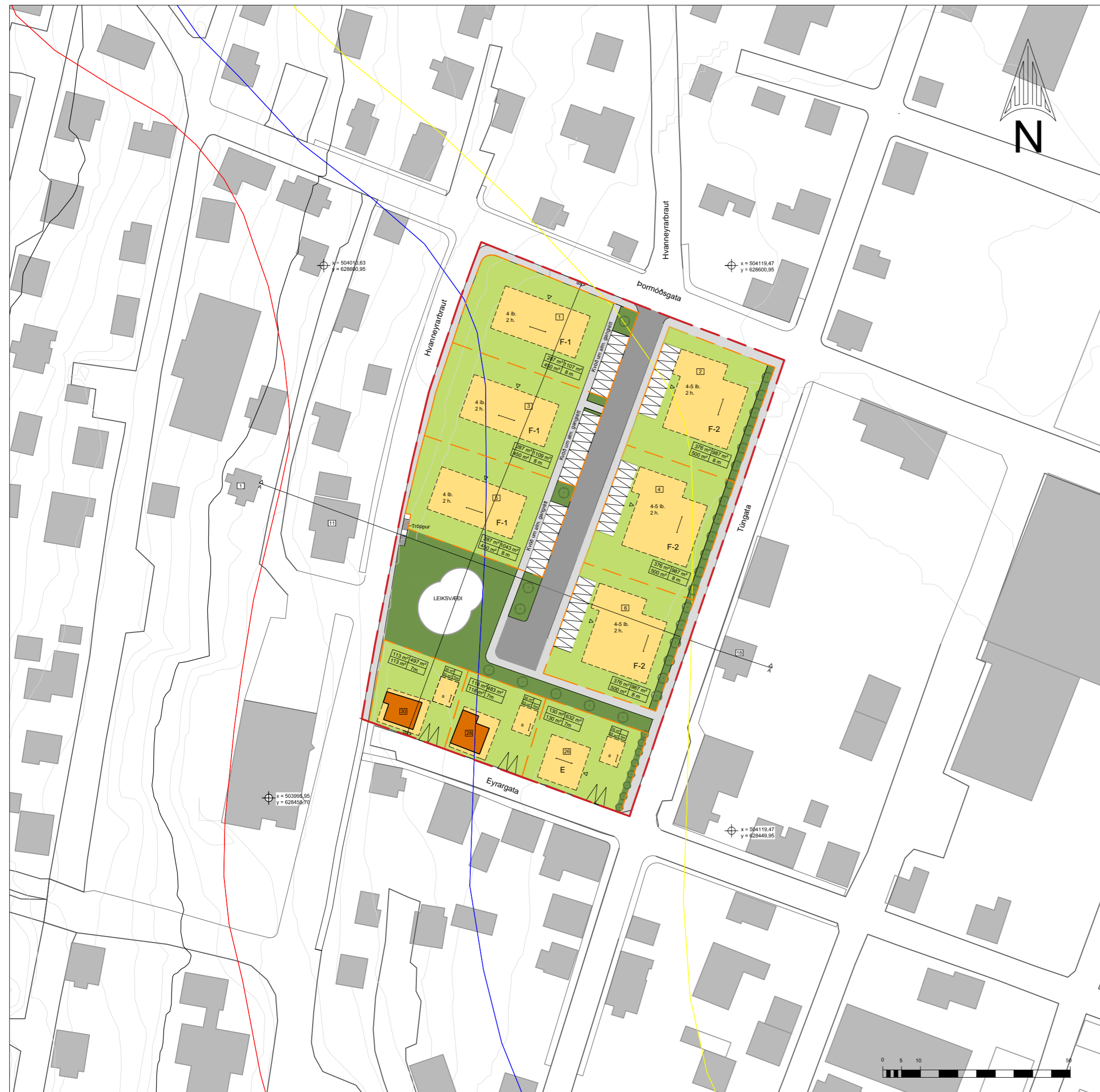
Skipulagsuppráttur mkv. 1:1.000