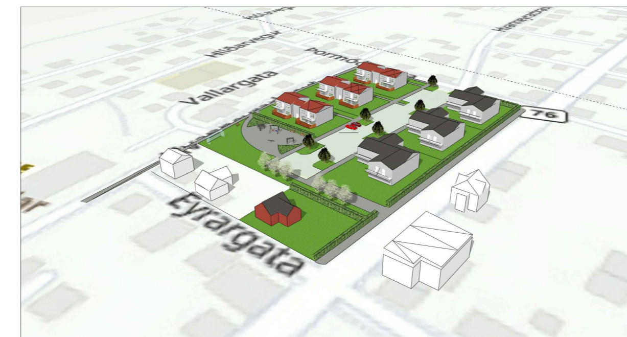
Útfærsla í þrívídd - aðeins til skýringar

Gidlistaka deiliskipulagsins var auglýst í B-deild Stjórnartíðinda þann _____