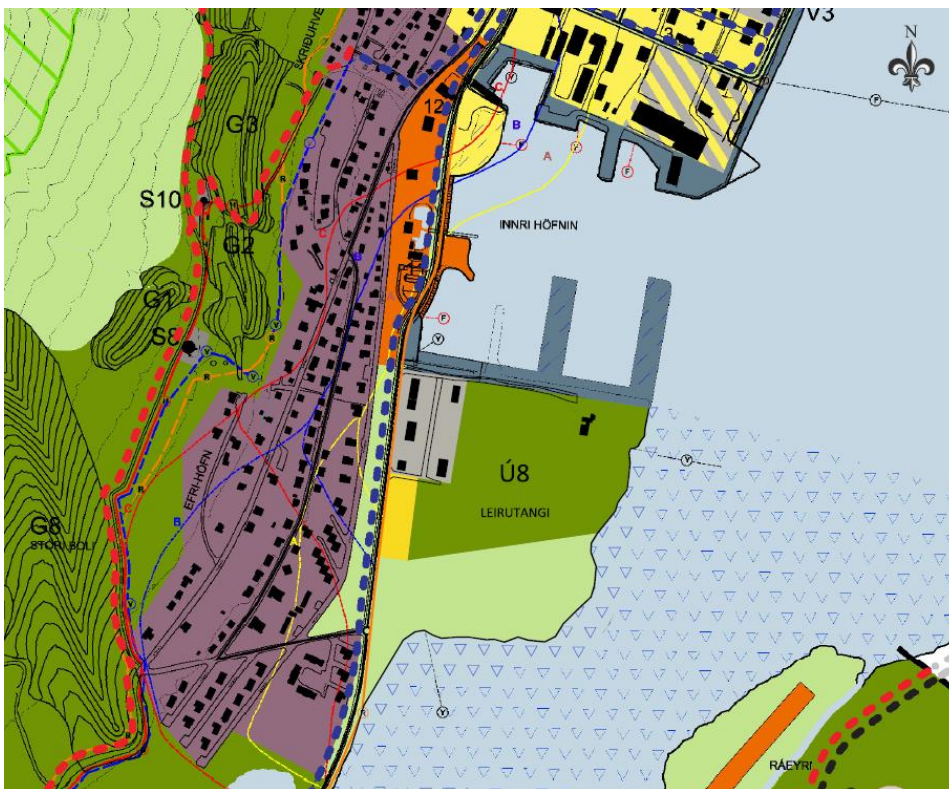
3. mynd. Drög að breyttu aðalskipulagi.

Í Aðalskipulagi Fjallabyggðar 2008-2028 er norðurhluti skipulagssvæðisins skilgreindur sem athafnasvæði en suðurhlutinn sem íbúðarsvæði. Þeirri landnotkun mun verða breytt í opið svæði til sérstakra nota fyrir tjaldsvæði og útivist, óbyggt svæði fyrir gríðland fugla og verslun og þjónustu fyrir eldsneytisstöð og verslun.