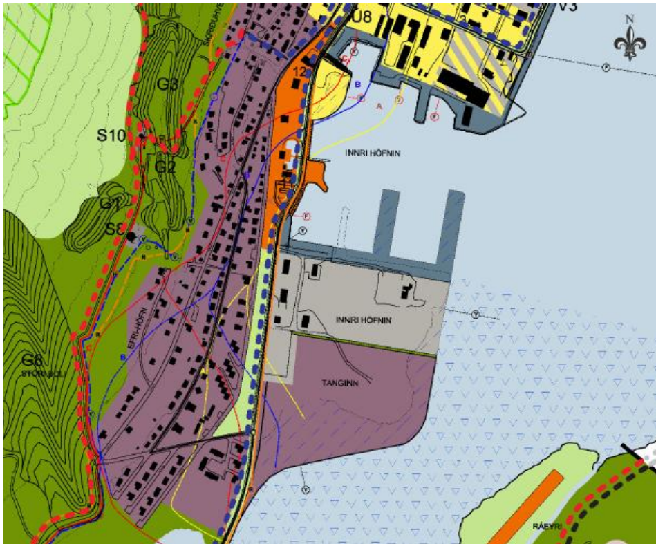
2. mynd. Hluti gildandi Aðalskipulags Fjallabyggðar 2008-2028.

Í Aðalskipulagi Fjallabyggðar 2008-2028 er norðurhluti skipulagssvæðisins skilgreindur sem athafnasvæði en suðurhlutinn sem íbúðarsvæði. Þeirri landnotkun mun verða breytt í opið svæði til sérstakra nota fyrir tjaldsvæði og útivist, óbyggt svæði fyrir gríðland fugla og verslun og þjónustu fyrir eldsneytisstöð og verslun.