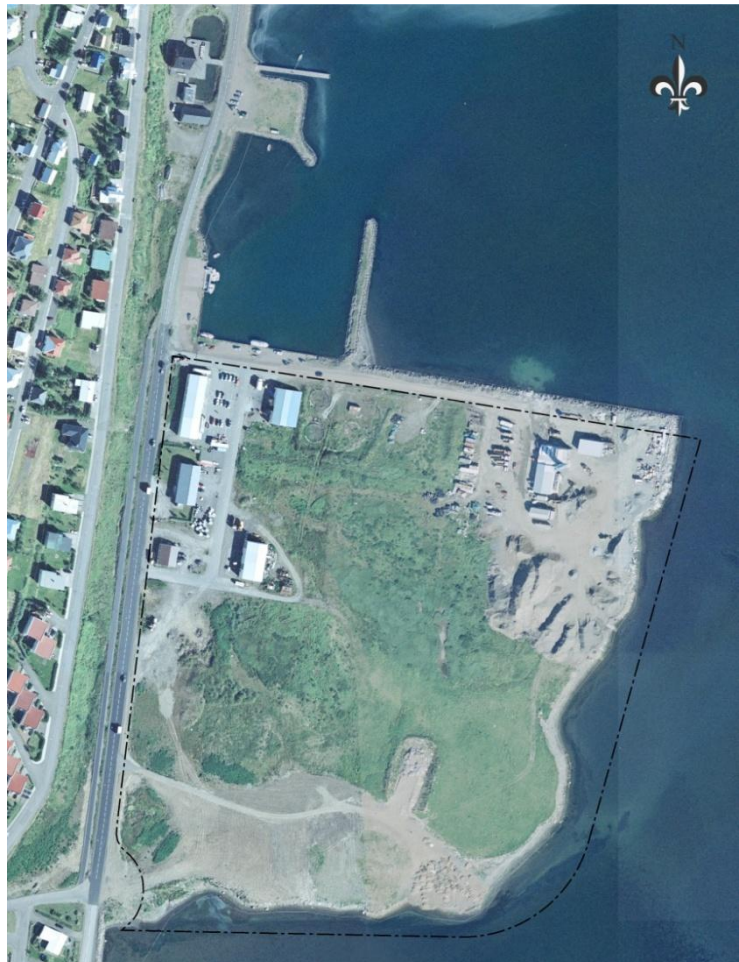
1. mynd. Loftmynd með skipulagsmörkum.

Á norðurbakka Leirutanga er smábátahöfn með tilheyrandi umferð og mannlífi. Austast á tanganum er steypustöð, en stefnt er að því að sú starfsemi verði flutt. Meðfram Snorrögötu við Vesturtanga og Suðurtanga eru nokkrar athafnalóðir og standa þar fimm byggingar fyrir atvinnustarfsemi. Sunnan athafnsvæðisins er í gildi deiliskipulag með einni lóð fyrir eldsneytisstöð og verslun. Svæðið er að öðru leyti óbyggt og ófrágangið.