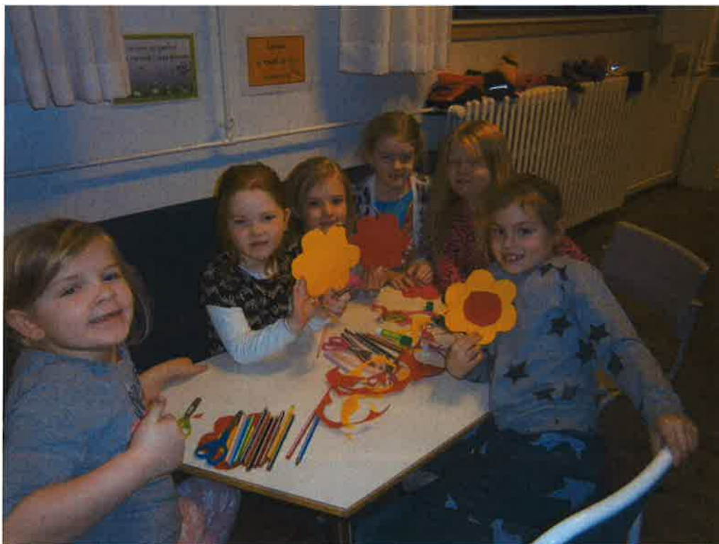
Nemendur við Tjarnarstíg á Uppbyggingardegi

Settar eru fáar en skýrar grundvallarreglur í skólanum ásamt umgengnisreglum í hverri starfsstöð.