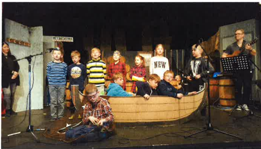
3.-4. bekkur á Vorhátíð skólans

Vorhátíð 1.-7. bekkjar var haldin í Tjarnarborg í Ólafsfirði miðvikudaginn 25. mars. Sýningin hófst með söngsal allra bekkja en síðan var hver bekkur með sitt atriði. Vorhátíðin var fjáröflun 7. bekkjar