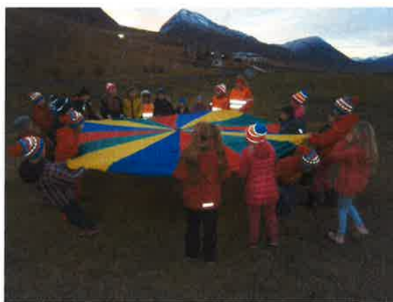
Vinaliðar að störfum