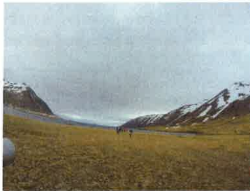
Nemendur 6. bekkjar í fuglaskoðun

„Dearyou“ var stofnað í Finnlandi árið 2013 og er tilgangurinn að börn í ólíkum löndum og heimsálfum kynnist og læri um siði þeirra og venjur. Í hverjum mánuði eru unnin verkefni og send til pennavinanna, og í staðinn fær bekkurinn verkefni þeirra sent að utan. Verkefnin tengjast námsþáttum hvers bekkjar, samþætting námsgreina eins og myndmenntar og samfélags- og náttúrufræði. 1. og 2. bekkur HÓ gerðist þátttakandi og vinabekkur þeirra er í skólanum „Amy Parks Heath Elementary School“ í Heath í Texas. http://www.dearyouartproject.com/happenings/2016/2/26/from-iceland-to-texas-with-love Samskiptin hófust í byrjun janúar 2016 og síðasta verkefnið var unnið í maí.