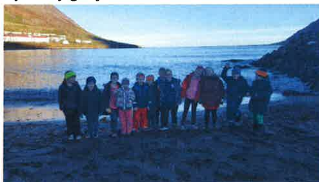
Nemendur í fjöruferð á hreystidegi í okt

Hreystidagar voru 5 á skólaárinu og sá hreystiteymið um skipulagningu þeirra. Sjá nánari greinargerð frá hreystiteymi í fylgiskjali.