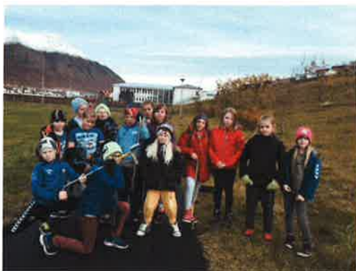
5. bekkur við gróðursetningu plantna

Skólinn á samvinnu við félagsmiðstöðina Neon sem starfrækt er í gamla Billanum á Siglufirði og í UÍF-húsinu í Ólafsfirði. Sömu nemendur skipa nemendaráð og félagsmiðstöðvarráð.