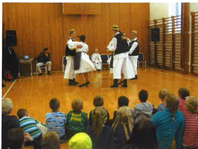
Rúmenskir þjóðdansarar í heimsókn