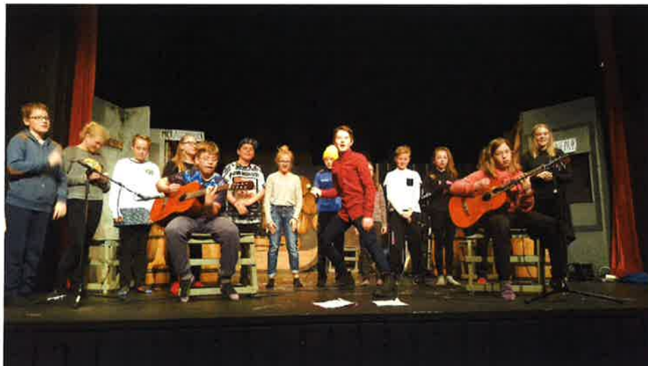
Nemendur 7. bekkjar á Vorhátíð skólans.