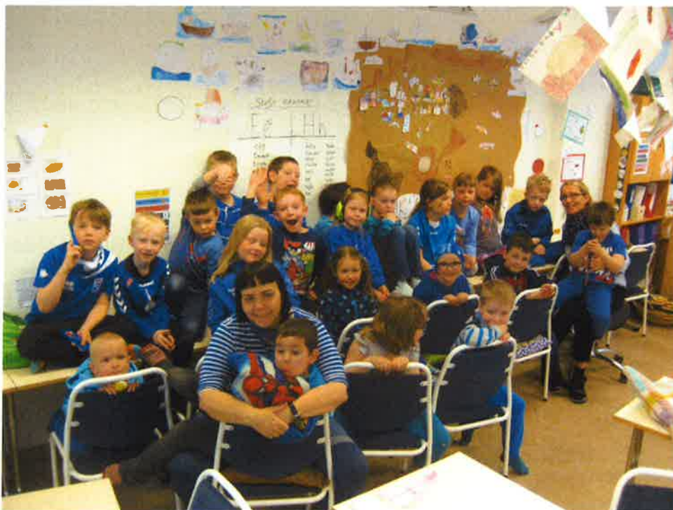
Nemendur 1. og 2. bekkjar á Siglufirði ásamt kennara sínum á Degi einhverfra

Skólarúta för frá Ólafsfirði kl. 7:35 á morgnanna og frá Siglufirði kl. 8:00