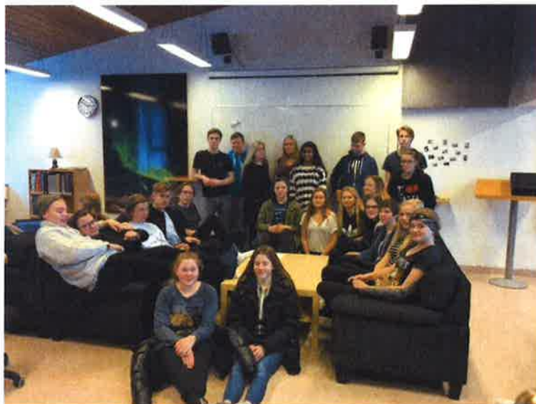
Nemendur 10. bekkjar heimsækja MTR