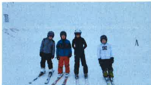
Nemendur á miðstigi á skíðadegi í Skarðinu