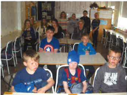
Umhverfisnefndir við Norðurgötu.

Teymið hefur sóst eftir því að starfa áfram næsta vetur. Nemendur eru áhugasamir að hefja samstarfið og hafa sýnt ábyrgð og áhuga.