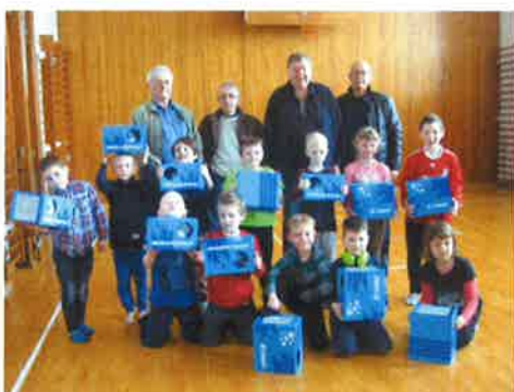
Nemendur 1. bekkjar fengu reiðhjólahljálma að gjöf