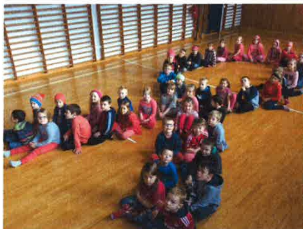
Nemendur 1.-4. bekkjar v/Norðurgötu á bleikum degi

Lögð er áhersla á gott upplýsingaflæði til foreldra í gegnum tölvusamskipti. Foreldrar hafa fengið lykilorð að Mentor sem veitir þeim aðgang að ýmsum upplýsingum sem varðar þeirra börn.