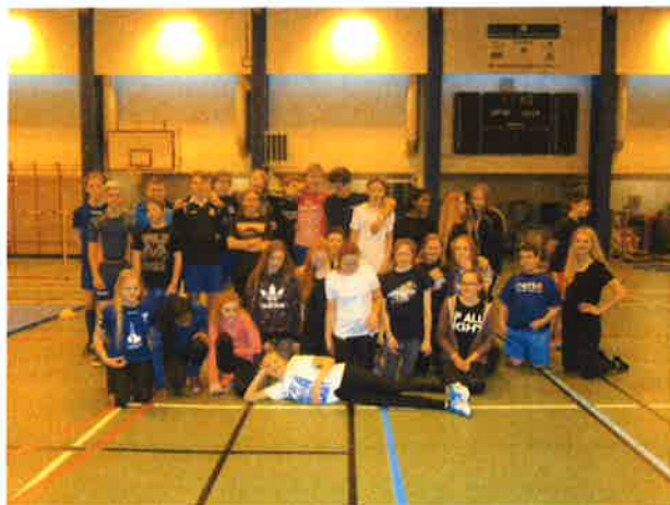
Keppendur í innanskólakeppni Skólahreystis

Nemendaráð lagði til að fá íþróttasal skólans til afnota í löngu frímínútum í vetur og úr því varð. Nemendaráð skipulagði og sá um leiki í salnum og gekk það vel. Einnig sá nemendaráð um að spurningkeppni yrði á unglíngastiginu annan hvern fimmtudag í löngu frímínútunum. Og skipulagði nokkra þemadaga í skólanum t.d. náttfatadag, bláan dag, bleikan dag o.s.frv.