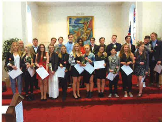
Nemendur 10. bekkjar við útskrift 6. júní 2016