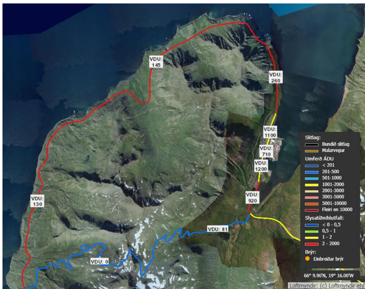
Mynd 3. Slysatíðni 2012-2016 [2].

Umferð á vegkafla 76-09 á Siglufjarðarvegi er um 295 ökutæki/sólarhring að meðaltali allt árið en á sumrin er umferð um 510 ökutæki/sólarhring og á veturna umtalsvert minni umferð eða um 130 ökutæki/sólarhring. Á tímabilinu 2012-2016 voru þar skráð 10 slys eða að meðaltali um 2 slys á ári. Útreiknuð slysatíðni er 1,89 fyrir milljón ekna km sem er 2,3 sinnum hærri tíðni en meðaltal á þjóðvegum landsins. Rétt norðan við Almenna, á vegkafla 76-10 sem nær inn fyrir Strákagöng, er slysatíðni þó tæplega þrisvar sinnum hærri og setur þann vegkafla í flokk með hættulegustu vegum landsins, sjá mynd 3 sem tekin er af heimasíðu Vegagerðarinnar. Ekki hefur verið kafað ofan í orsök þessara slysa en leiða má líkur að því að grjóthrun og skemmdir á vegi eigi drjúgan þátt í þeim fjölda slysa sem skráð eru á þessum vegaköflum.