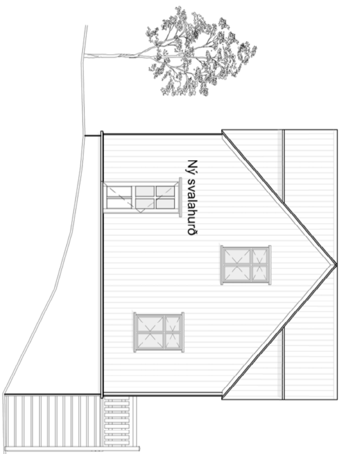
Útlit Suður 1:100