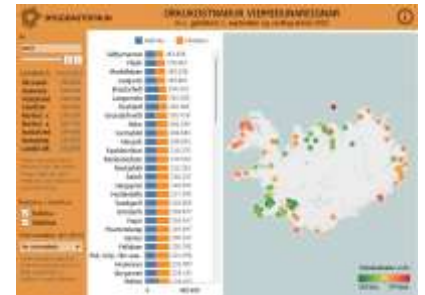
Skjáskot úr mælaborði

Líkt og undanfarin ár hefur Bygðastofnun fengið Orkustofnun til að reikna út kostnað á ársgrundvelli, við raforkunotkun og húshitun á sömu fasteigninni, á flestum þéttbýlisstöðum og í dreifbýli. Viðmiðunareignin er einbýlishús, 140 m 2 að grunnfleti og 350m 3 . Almenn raforkunotkun er sú raforka sem er notuð í annað en að hita upp húsnæði, s.s. ljós og heimilistæki, en miðað er við 4.500 kWst í almennri rafmagnsnotkun og 28.400 kWst við húshitun án varmadælu en 14.200 kWst með varmadælu.