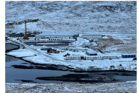
Seiðaeldisstöð Arctic Fish í Tálknafirði.