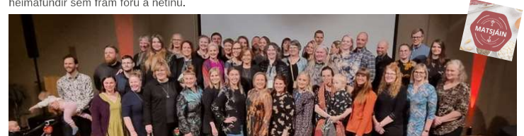
Hópur þátttakenda uppskeruhátíðar Matsjárinnar á Hótel Laugarbakka.

Á dögunum var haldin glæsileg uppskeruhátíð og matarmarkaður Matsjárinnar á Hótel Laugarbakka á Norðurlandi vestra. Um var að ræða lokaviðburð 14 vikna "masterclass" námskeiðs sem fór af stað í byrjun janúar 2022. Á þessu 14 vikna tímabili voru haldnir sjö fræðslufundir og sjö svokallaðir heimafundir sem fram fóru á netinu.