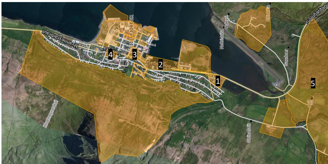
Mynd 3: Gildandi deiliskipulög á Siglufirði.

Í gildi er deiliskipulag við Eyrarflöt (1) sem liggur að skipulagsmörkum þjóðvegur í þéttbýli, einnig er í gildi deiliskipulag Snorragötu (2), deiliskipulag miðbæjar Siglufjarðar (3), deiliskipulag íbúðarsvæðis á malarvellinum á Siglufirði (4) og deiliskipulag í Skarðsdal (5). Gera þarf ráð fyrir að gildandi deiliskipulagsáætlanir er hafa mörk innan skilgreinds þjóðvegur þurfi e.t.v. endurskoðun m.t.t. breytinga. T.d. tilheyrir hluti þjóðvega deiliskipulagi miðbæjarins; annars vegar Túngata frá Gránugötu að Hvanneyrarbraut og hins vegar Gránugata frá Túngötu að Grundargötu og hluti þjóðvega tilheyrir einnig deiliskipulagi Snorragötu.