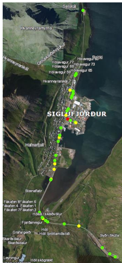
Mynd 5: Slyss og óhöpp við þjóðveg í gegnum Siglufjörð 2013-2021, Vegagerðin.