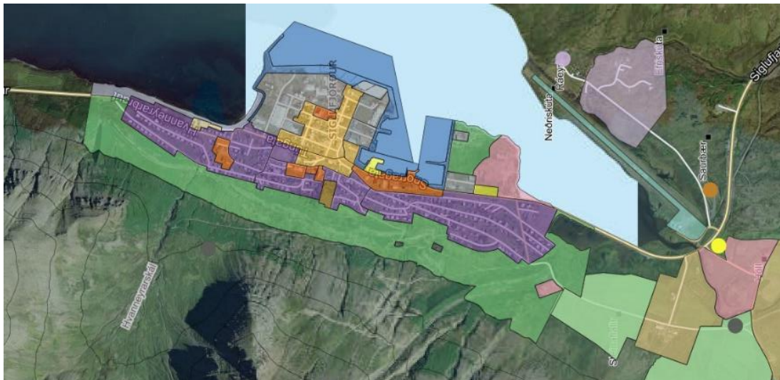
Mynd 2: Drög að aðalskipulagi á Siglufirði (kortasjá Fjallabyggðar).

Nýtt aðalskipulag Fjallabyggðar hefur verið samþykkt og sent Skipulagsstofnun til lokaafgreiðslu og gildistöku.