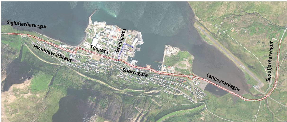
Mynd 1: Yfirlitsmynd af Siglufirði. Deiliskipulagsmörk með þjóðvegum í þéttbýli sýnd með rauðri og blárri strikalinu.

Þjóðvegir í þéttbýli Siglufjarðar eru tveir og flokkast þeir báðir sem stofnvegir. Annars vegar Siglufjarðarvegur (76) frá suðri við vegamótin við Skarðsveg (793), gegnum bæinn (Langeyrarvegur/Snorrágata/Túngata/Hvanneyrarbraut) og fram yfir áningarstað norðan Hólavegar (sjá merkt með rauðu á mynd hér að neðan). Hins vegar Gránugata (792) frá vegamótum við Snorrágötu (76) (sjá merkt með bláu á mynd hér að neðan). Heildarlengd er um 3,5 km.