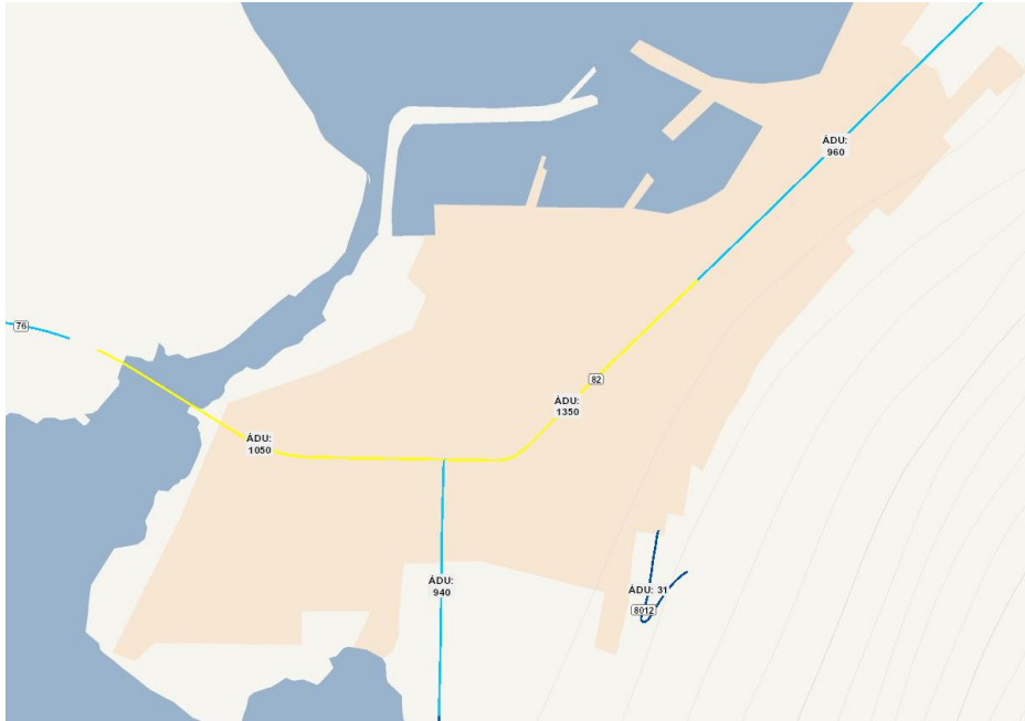
Mynd 4: Umferð 2020, Vegagerðin.