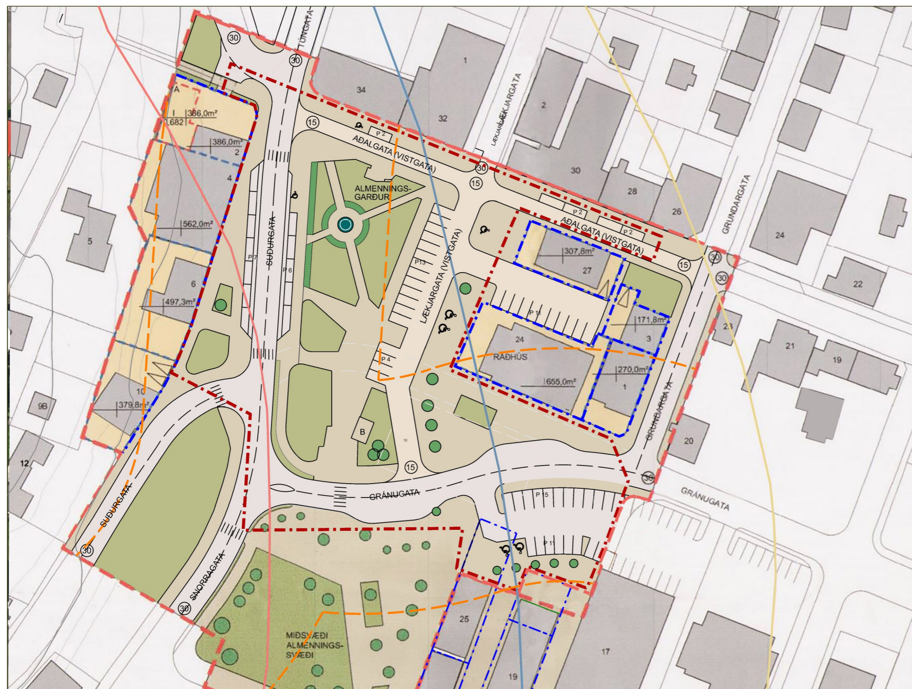
Tillaga að breytingu á deiliskipulagi í mars 2024. Mkv. 1:1000