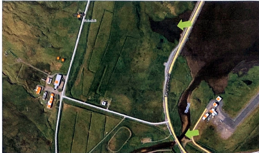
Staðir til vatnstöku nærri Lambafeni

Vegalengd frá: Lambafen að tjörn við Langeyrarveg 556 = 556 m. Lambafen að Fjarðará við flugvöll = 615 m.