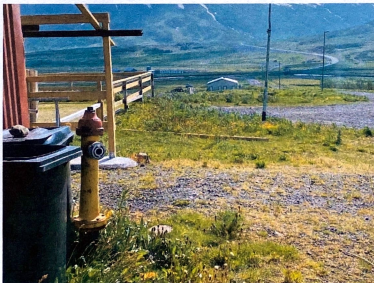
Séð frá brunahana í hesthúsahverfi í átt að Lambafeni.

Nú þegar er brunahani við hesthúsahverfið. Hann er á stofnlögn og vatnsprýstingur góður. Um 6 kg. Einn stútur er á brunahananum.