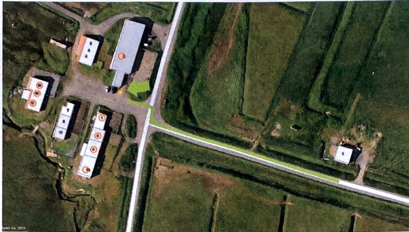
Vegalengd frá brunahana í hesthúsaferfi og að Lambafeni er um 181 m. sé lagt meðfram vegi.

Samanborið við aðra brunahana á Siglufirði og vegalengdir þeirra á milli má sjá samantekt hér að neðan.