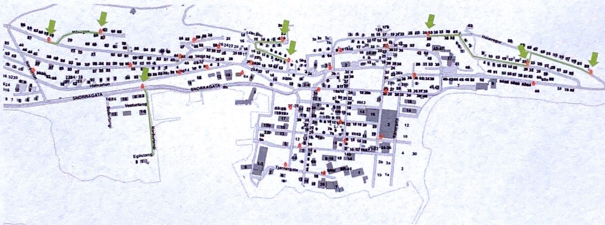
Þéttbýliskort af Siglufirði með brunahönum

Samanborið við aðra brunahana á Siglufirði og vegalengdir þeirra á milli má sjá samantekt hér að neðan.