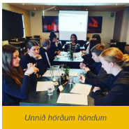
Unnið hörðum höndum

Ungmennaping SSNE fór fram í Mývatnssveit dagana 25. - 26. nóvember síðastliðinn. Þar voru saman komin um 30 ungmenni úr sveitarfélögum landshlutans og tókust á við áskoranir Heimsmarkmiða Sameinuðu þjóðanna, sem var jafnframt þema þingsins.