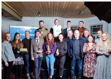
Á mynd eru þátttakendur Vaxtarrýmis 2021 ásamt teymi Norðanáttar.

Lokaviðburður Vaxtarrýmis var haldinn hátíðlega föstudaginn 26. nóvember sl. á Akureyri. Átta nýsköpunarteymi kynntu stórglæsileg verkefni sín og var viðburðinum streymt á netinu en þeir sem mættu nutu veitinga í föstu og fljótandi formi.