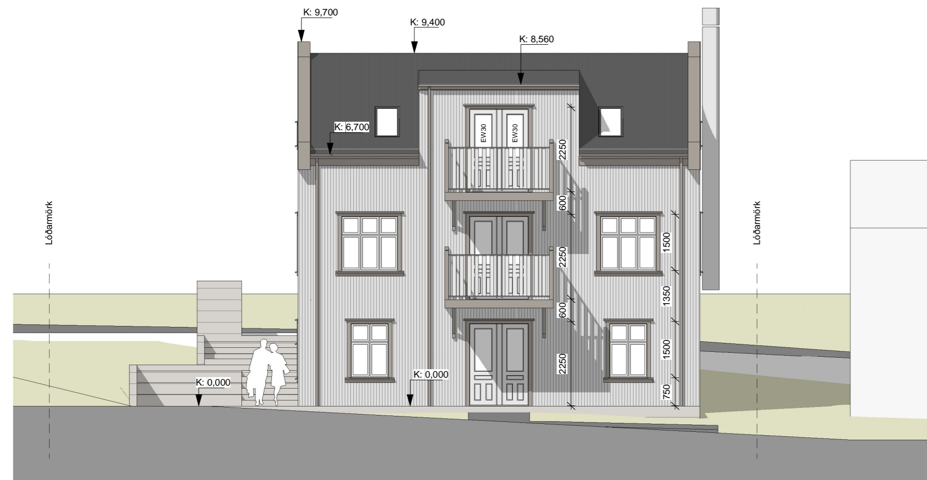
ÚTLIT - AUSTUR 1 : 100