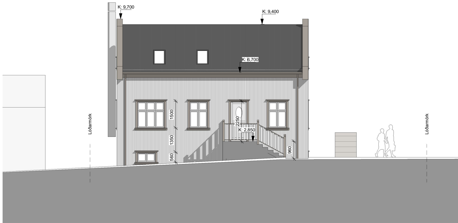
ÚTLIT - VESTUR 1 : 100