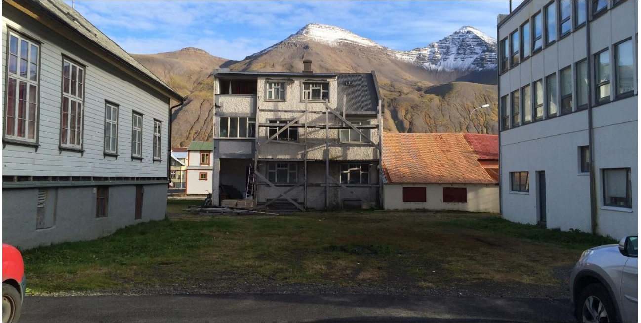
Mynd 9. Núverandi aðstæður, port á milli Ráðhússins og Aðalgötu 27 þar sem gert er ráð fyrir bílastæðum.

Suðurgata hliðrist til austurs á milli gatnamóta við Gránugötu og Aðalgötu. Þörf er á bílastæðum vegna verslunarstarfsemi í húsum við Suðurgötu en gert er ráð fyrir bílastæðum beggja megin götunnar á þessum stað, skástæðum (og akstursleið) sem eru aðskilin frá Suðurgötu með umferðareyjum. Gangstéttar verða við bílastæði og gangbrautir yfir Suðurgötu sunnan og norðan þeirra.