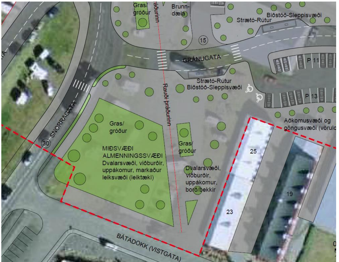
Mynd 7. Möguleg útfærsla á miðsvæði við smábátahöfn.