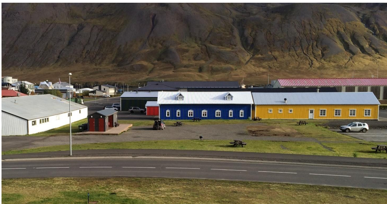
Mynd 6. Núverandi aðstaður, svæði norðan smábátahafnar.

Gert er ráð fyrir rými fyrir almenningssvæði og gönguleiðir norðan gönguássins sem liggur á milli bygginganna Hannes Boy Café og Kaffi Rauðku, auk aðkomusvæðis fyrir vörulosun veitingahúsanna.