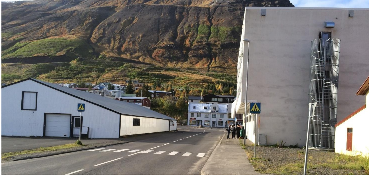
Mynd 8. Núverandi aðstæður, lega Gránugötu sunnan Ráðhúss. Vinstra megin á myndinni er skemman við Gránugötu 27-29 sem gert er ráð fyrir að víki af svæðinu.