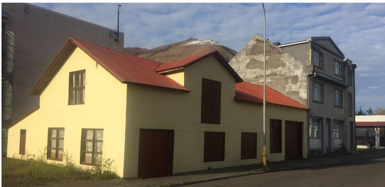
Mynd 3. Grundargata 1 (nær) og Grundargata 3 (fjær)

Tekið er undir þetta í deiliskipulagi og skal fengið álit Minjastofnunar Íslands við breytingar á húsunum.