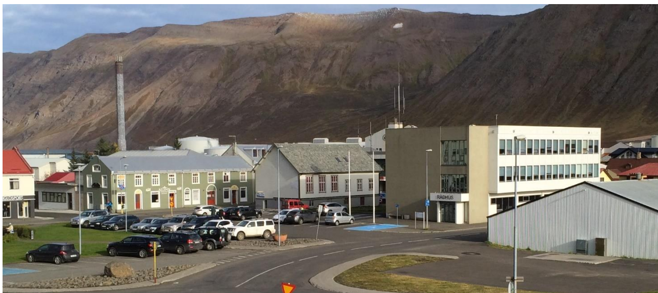
Mynd 4. Núverandi aðstæður, séð yfir Ráðhúsið, Aðalgötu 27 og nánasta umhverfi.

Við núverandi aðstæður eru bílastæði skilgreind fram við Ráðhúsið og Aðalgötu 27. Gert er ráð fyrir að bílastæði verði ekki framan við þessi hús fyrir utan stæði fyrir hreyfihamlaða, en þó er gert ráð fyrir nokkrum bílastæðum austan vistgötunnar Lækjargötu nær Gránugötu, sjá nánar í kafla 2.4.5.