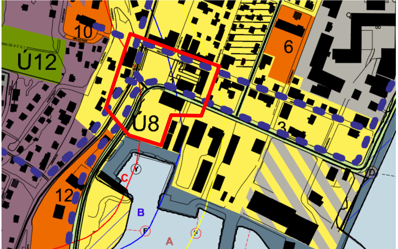
Mynd 2. Hluti aðalskipulags Fjallabyggðar, Siglufjörður, 2008-2028 (rauð útlína sýnir það svæði sem deiliskipulagið nær yfir).